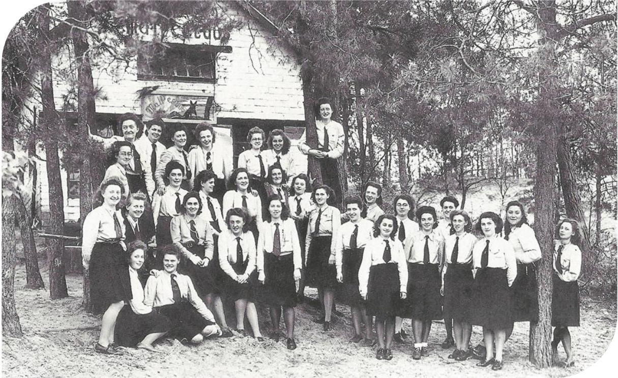
VKSJ-groep op vormingskamp in Malpeltuus, mei 1946; foto overgenomen uit Bewogen Beweging , 60 jaar KSA-KSA-VKSJ, p. 60.

In Bel bij Geel gingen al in de jaren 40 KSA- en VKSJ-groepen op kamp in de kampeerhut Malpeltuus , genoemd naar de burcht van de vos Reinaart. Het kamphuis Malpeltuus vind je nog steeds in de Kempense bossen en is in een zandheuvel gebouwd ( http://users.skynet.be/leo.otten ). Het is ons niet duidelijk of het oorspronkelijk een echt KSA- of VKSJ-kamphuis was.