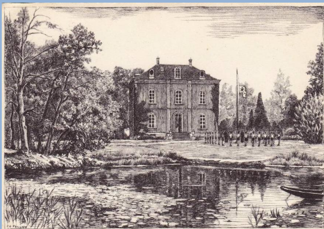
Kamppostkaart KSA Brabant met het kasteel Hertogenburg in Wespelaar