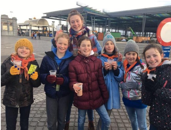
KSA Oostende bij het station, januari 2016

Er zijn enkele trouwe KSA-groepen die zich elk jaar inzetten voor Vredeseilanden, zoals KSA Lede en KSA Sint-Jan Tongeren (zeker al sinds 1987), maar als je vraag is wie vorig jaar ook op post stonden voor Vredeseilanden, dan denk ik aan een KSA-groep uit Edegem, aan KSA Eksel, KSA Zele, KSA Lede, KSA Grimbergen, KSA Habiba Heers, KSA Herentals, KSA Driekoningen, KSA Molenveld, KSA Oostende, KSA Parsival, KSA Pius X, KSA Rooyghem Sint-Kruis en Male, KSA Sint-Jan, KSA Trapsoet, KSA