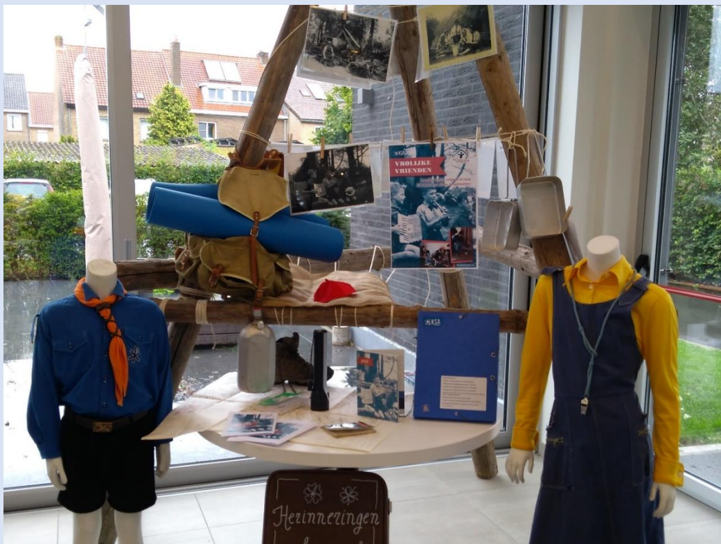
Voorstelling Vrolijke Vrienden in de expo 'Code Alzheimer 17' in wzc Westervier (Sint-Kruis, herfst 2017)