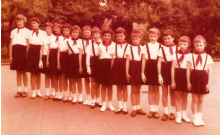
Roodkapjes van Izegem op kamp in het kasteel Kroonhove in Oostkamp in 1959