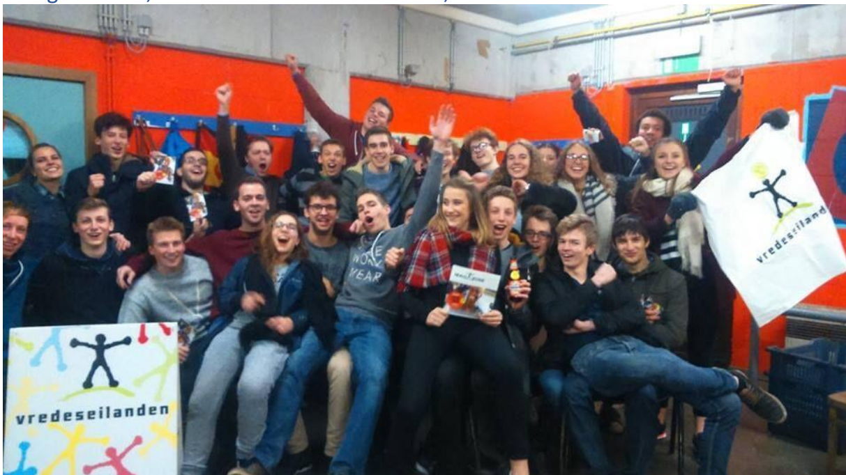
Enthousiaste verkopers van KSA Westmalle, januari 2016.

Westmalle, KSA Malle. Ik hoop dat ik geen groepen vergeet, want veel groepen worden rechtstreeks aangesproken door onze vrijwilligersgroepen die de campagne trekken in hun gemeente, waarin zeker ook oud-KSJ'ers, -KSA'ers en -VKSJ'ers zitten.