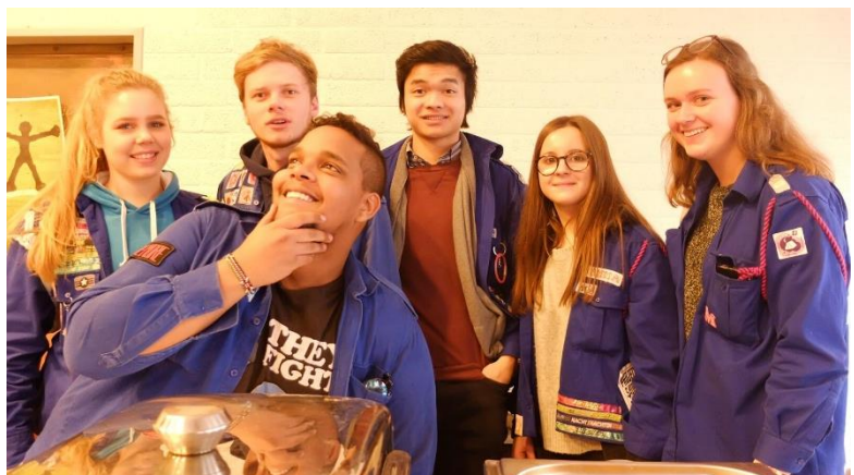
KSA Sint-Jan Tongeren bij hun (h)eerlijke maaltijd, januari 2017.

Solidariteit is er altijd geweest binnen jeugdbewegingen. Ik herinner me nog uit de archieven van KSA Rooyghem het sterzingen ten voordele van missie- en vierde-wereldprojecten. We zien ook dat heel wat jeugdbewegingen zich inzetten voor bv. 11.11.11 of Vredeseilanden (Rikolto). Dat is financieel gezien van levensbelang voor onze programma's, waarbij we streven naar een duurzaam voedingssysteem in de